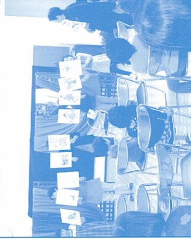
↑ 子どもたちと一緒にベアブサート