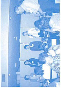
↑苓北町のみなさん