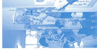
← 続々と入る子どもたち