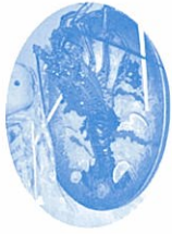
↑天草名物伊勢えびに 参加者の皆さんは大喜び