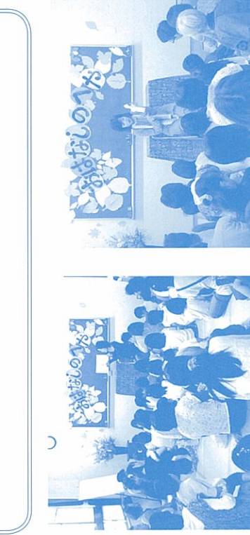
↑ 会場の様子・・・熱心に聞き入る子どもたち