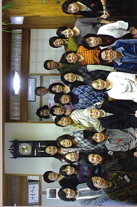
↑ゲストとスタッフ一同です。