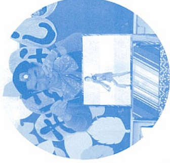
↑ 万五郎さんのマリオネット