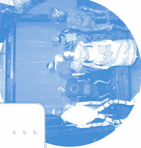
↑紙芝居を演じるお二人