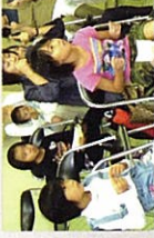
← ↑熱心に聞き入る 子どもたち