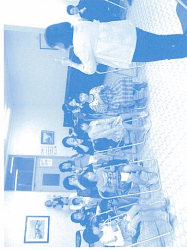
楽しんで聞き入る子どもたち