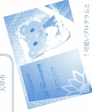
↑可愛いプログラムとお土産