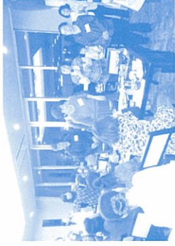
↑生深地区の皆さん