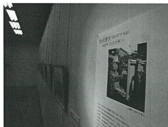
第3壁面(入口から左側/松田氏スケッチ)