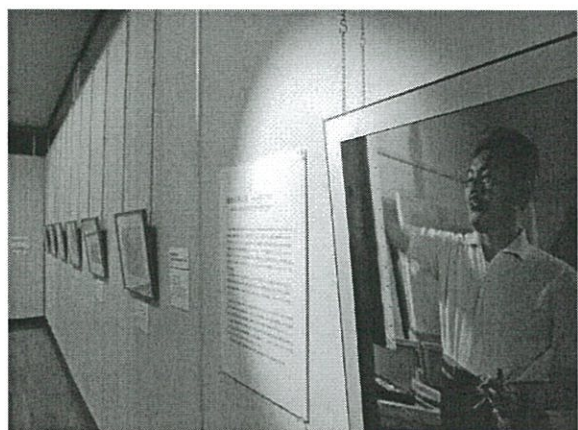
第1壁面(入口から右側/海老原画伯スケッチ)