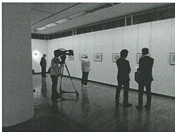
開催初日のRKKのテレビ取材