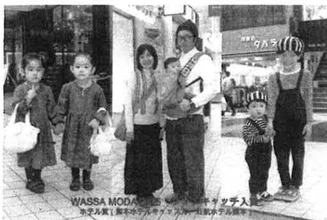
WASSA MODA 2015 フォトキャッチング ホ子丸賞 (熊本水産庁キッズカーニバル水産博覧会)