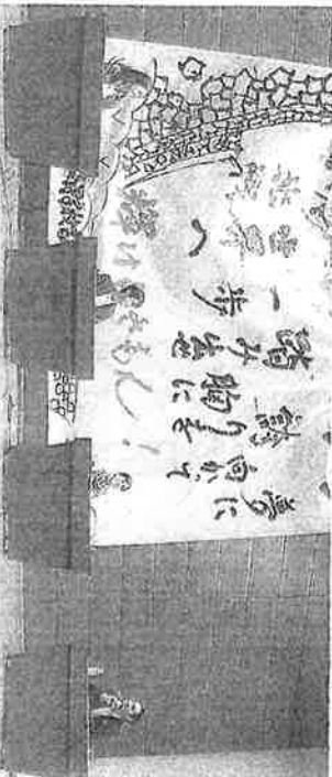
熊本市中央区の熊本学園大で開かれたトークセッション。11月21日、園田琢磨が撮影