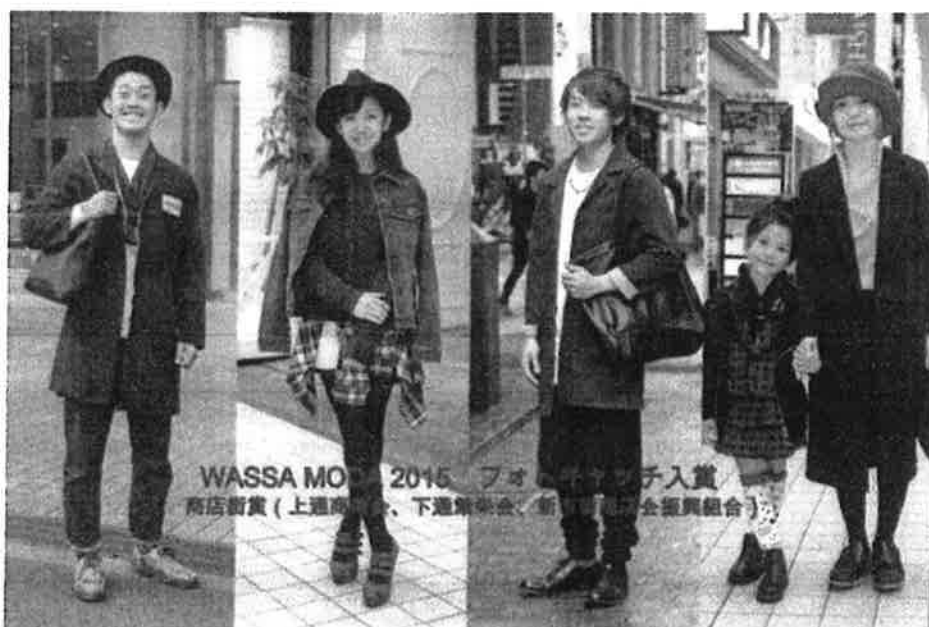
WASSA MODA 2015 フォトキャッチング 商店街賞 (上通商店会、下通商店会、新通商店会、全振興組合)