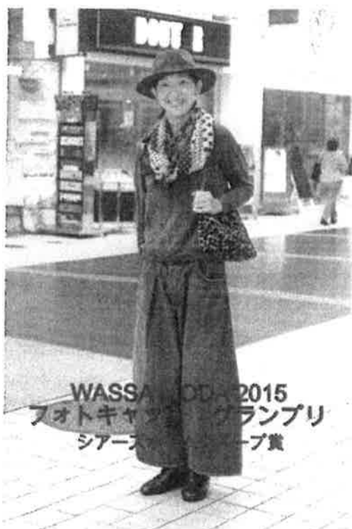
WASSA MODA 2015 フォトキャッチンググランプリ シアーブ賞