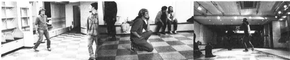
10/31前日会場当たり アイデアが次々と生まれる