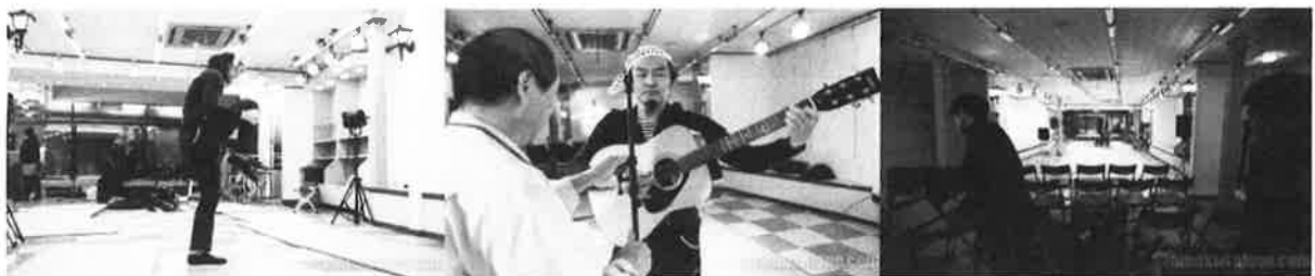
当日リハーサル 地元天草高校の生徒もボランティアで参加