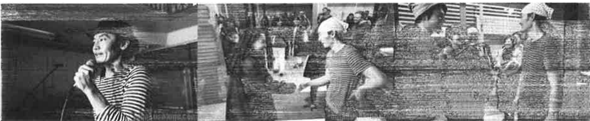
「天草にはまた来ます！」 終演後は会場入りで観客のはば全員と握手と言葉を交わした