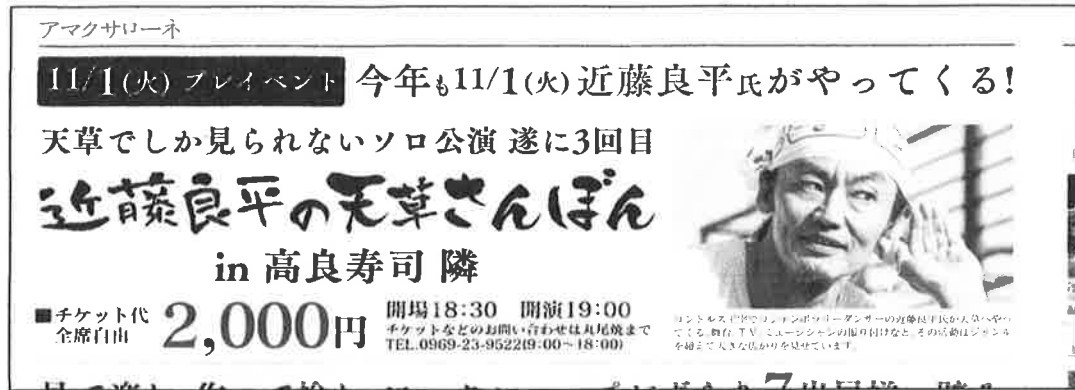
アマクサローネ総合パンフレット掲載部分