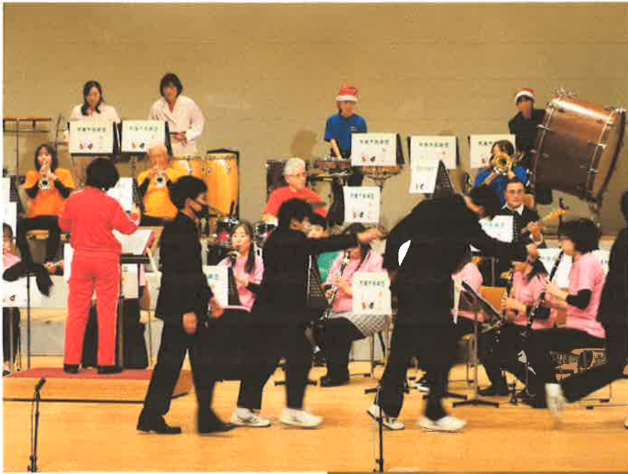
平成ドラマテーマコレクション