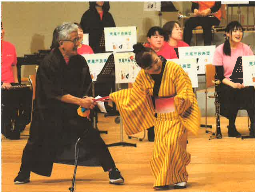
時代劇スペシャル