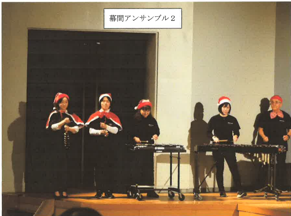
幕間アンサンブル2