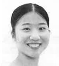
溜漕七虹 カサデアルテ芸術の家所属